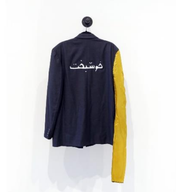
Elnaz Javani, Lucky (Limited Series The Fate), 2013. Hand-embroidered on the outer layer of an M-size men's coat, applique and thread, 180 x 90 cm each.