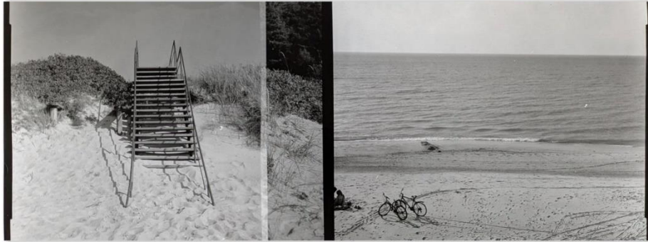
Gintautas Trimakas, Exits, 2012-13. Silver bromide prints, 22 x 55 cm.