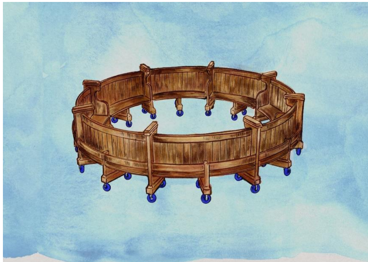
OrangeTerry, Found Faith (preparatory study), 2026.

艺术中环进一步确立“异体雕塑及装置项目”作为艺术家突破展位框架、实现更大围度创作的平台。2026 年度将呈现五组全新且具规模与深度的装置作品，其中三组由香港艺术家呈献。