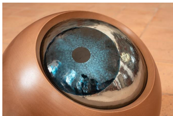
Marta Fréjuté, Error (detail), 2024. Wood, glass, mixed media, various sizes.

香港特別行政區政府僅為藝術中環展會 2026 提供撥款資助，並無參與其中。在刊物／活動內（或獲資助者轄下計劃小組成員）表達的任何意見、研究成果、結論或建議，純屬藝術中環展會 2026 的推行機構的觀點，並不代表香港特別行政區政府的觀點。