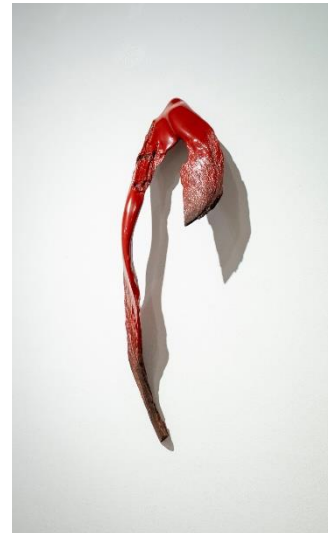
Kohei Ukai, Connect II, 2025. Camphor wood, hemp, urushi lacquer, 25 x 95 x 15 cm.