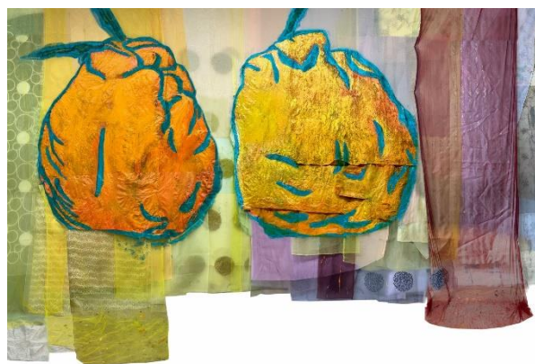
Jeong-A Bang, The Space Between Us (detail), 2025–26. Acrylic on a translucent cloth, 400 x 650 cm.