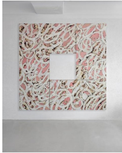
Casper Kang, Star 271, 2023. Burnt hanji, ottchil hanji, fluorescent magenta acrylic on linen hemp, 230 x 230 cm.