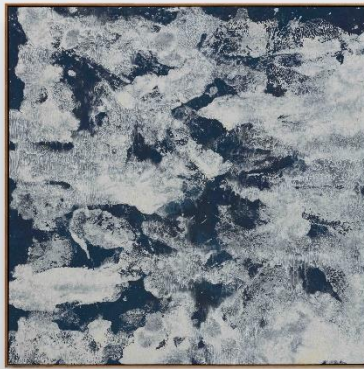
Ma Kelu, Ada Silver, 2017. Oil on canvas, 146 x 146 cm. Courtesy of the artist and BOUNDED SPACE.

Neo 进一步巩固艺术中环作为新秀跃升平台的关键角色，连结藏家与观众，聚焦于正迈入创作关键阶段的艺术家，同时呈现跨越世代与地域、正在塑造当代艺术面貌的鲜明声音。 Neo 将于 2026 年迎来六家回归画廊，并新增四家首次参展单位，带来具前沿性或尚待发掘的新锐艺术家。