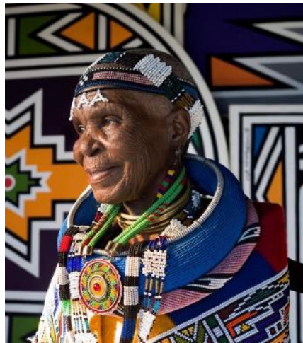
Esther Mahlangu.