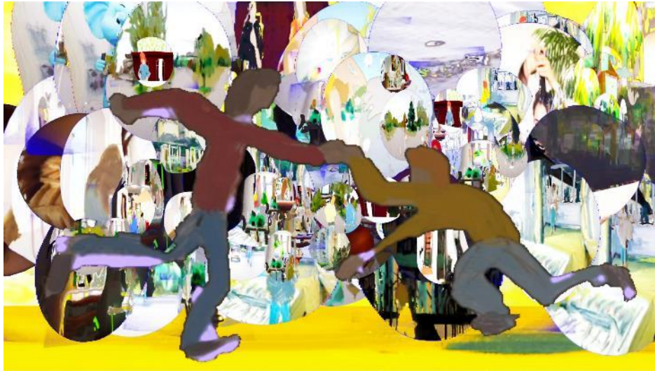
Yifan Jang, One Sunday Morning , 2021. Single-channel animated video, 13'12".