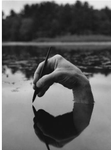
Arno Rafael Minkkinen, Fosters Pond , 2000. Gelatin silver print, 50 x 60 cm.

影奖”（ Académie des Beaux-Arts Photography Award, William Klein ）。其作品获多家重要机构永久收藏，当中包括纽约现代艺术博物馆、芬兰国家美术馆（赫尔辛基）、蓬皮杜中心（巴黎）及东京都写真美术馆。