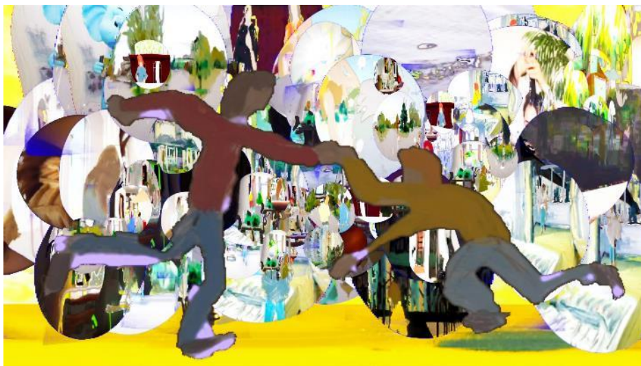
Yifan Jang, One Sunday Morning , 2021. Single-channel animated video, 13'12".

2026 年度影像藝術節目「房間裡的泡泡」致力呈現區域性與國際當代影像創作的多元面貌，聚焦人際互動的細膩之處與意義建構的思辨性過程。人工智能雖能處理龐大數據，卻難以捕捉細微語氣與情感紋理；本節目以此技術缺口為切入點，將之視為日常溝通中種種錯位的隱喻，從而凸顯人與人之間嘗試理解彼此時所存在的張力、遲疑與情感暗流。